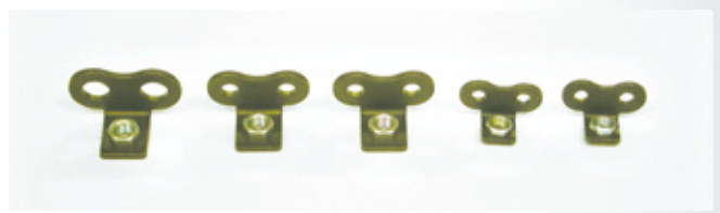
プレスナット付アタッチチェーン