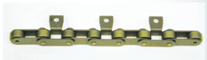
切込みアタッチメント付